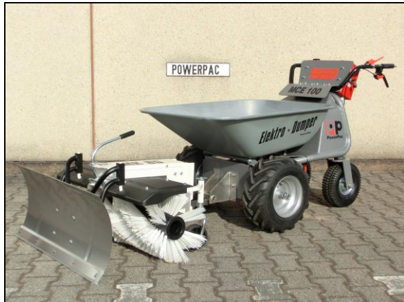
Kehrbesen 85cm - mech. schwenkbar inkl. Schneeschild 85cm und Adapter