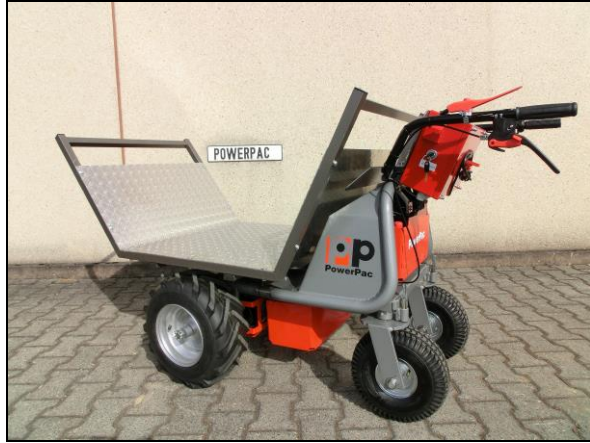
Transportaufsatz für z.B. Holz, Leichtgut, Rollrasen etc.