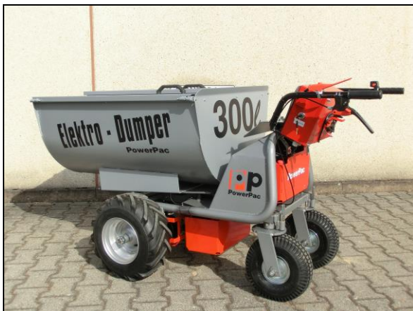
Futterwanne 300ltr. aufgebaut auf MCE400 mit verlängertem Rahmen