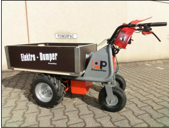
Transportkiste mit abnehmbaren Bordwänden 90x79x26cm