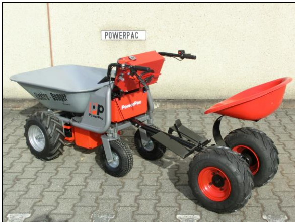
Anhängesitz mit Adapter, gefederten Sitz und Fußbremse