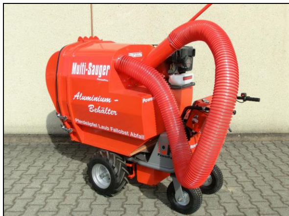
Multi-Sauger Typ MCS520 aufgebaut auf MCE400 mit verlängertem Rahmen