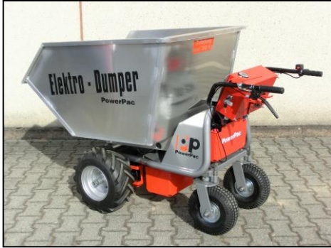
Leichtgutwanne 450ltr. Maße der Wanne: 1035x850x565mm