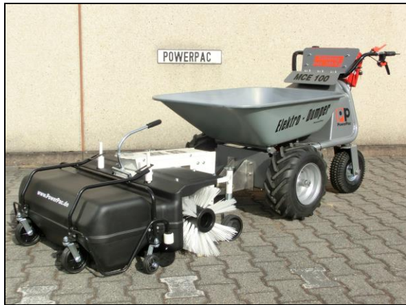
Kehrbesen 85cm - mech. schwenkbar inkl. Auffangbehälter 60ltr. und Adapter