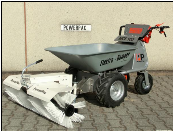
Kehrbesen 105cm - mech. schwenkbar inkl. Adapter