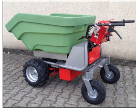
Kunststoffmulde massiv 350ltr. Maße der Mulde: 1140 x 770 x 490 mm